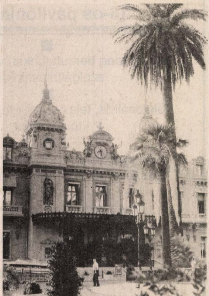
A monte-carlói játékkaszinó: a szerencse helyett érdekesebb a tudásra alapozni

A Riviérán, ahol a nap-sütötte tengerpart és a havas hegycsúcsok karnyújtásnyi közelségben kínálják magukat, bátran építhetnek az idegenforgalomra, dűsgazdagon megél belőle a vidék, gondolná az ember. Am másképp vélekedett még a hatvanas évek végén Pierre Laffitte, a francia törvényhozás szenátora. Úgy hitte, több lábón kell állnia Dél-Provence-nek, és romantikus hevülettel hozzálátott a tudomány letelepítéséhez. Olyan tevékenységet kívánt meghonosítani az Azúr-parton, mely nem gátolja az idegenforgalom virágzását, sőt, növeli a vonzerőt, ugyanakkor lehetőséget nyújt a helyieknek egyéb tehetőségük kibontakoztatására.