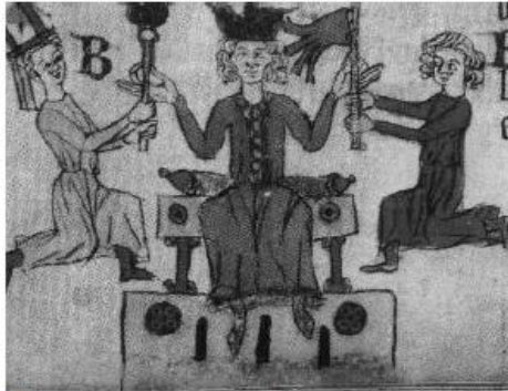
Krisztus a pápának a mennyország kulcsát, a császárnak pedig kardot ad.

Mutassa be a források és ismeretei alapján az egyház szerepét a középkori művelődésben és a mindennapokban!