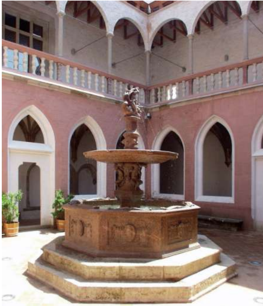
Mátyás kori díszudvar a Herkules kúttal