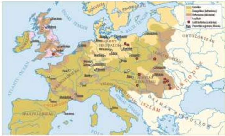
A népszerű 16. századi Európa

Szörnyülködhetünk a Duna és a Majna csatorna helyett folyóval – ráadásul már az újkor elején – való összekötésén, a lengyel területre eső Felső-Tisza-vidéken vagy a Szászországhoz csatolt Észak-Csehországon. 6 A reformkor gazdaságát és nemzetiségeit bemutató térképeken hibásan jeleznek horvátokat a lengyel határnál, ismeretlen eredetű népcsoportot Baranyában, kiterjedt román népességet a Délvidéken, viszont ugyanott szerbet alig. Megjelenik