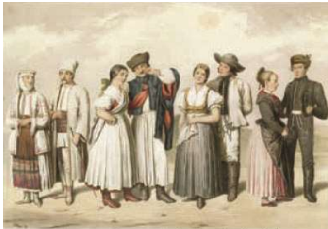
Magyarország nemzetiségei: románok, németek, szlovákok és horvátok (Gabriel de Pronay színezett rézmetszete; 1855)

Tartalmi hibák is maradtak az „összeszerkesztés” után, hiszen például a Magyarország nemzetiségei című (193. o.) színezett (a tárgyalt